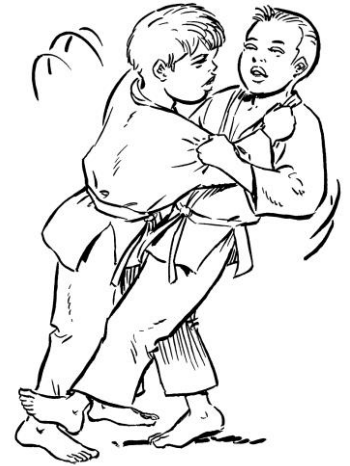
HARAI TSURIKOMI ASHI