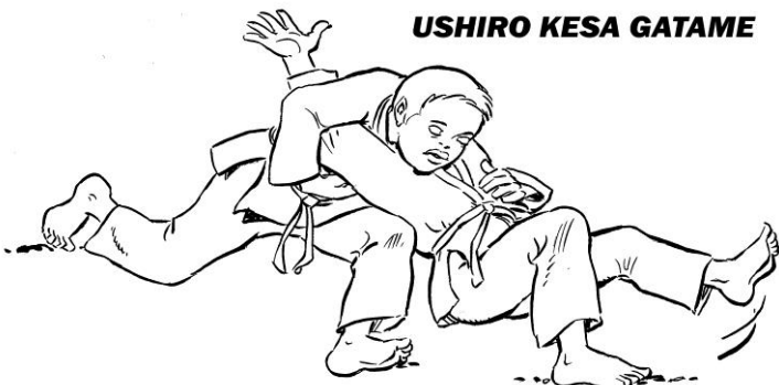
USHIRO KESA GATAME