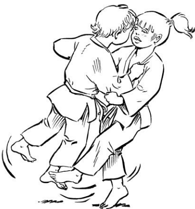
OKURI ASHI BARAI