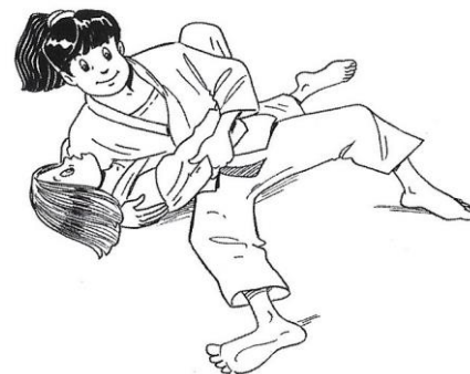
HON-GESA-GATAME CONTRÔLE LATÉRO-COSTAL