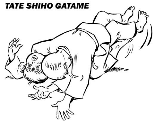
TATE SHIHO GATAME