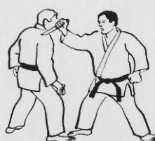
NANAME UCHI SÉRIE D