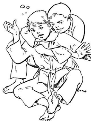
OKURI ERI JIME