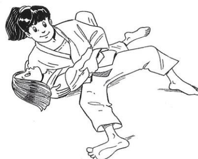
HON-GESA-GATAME CONTRÔLE LATÉRO-COSTAL