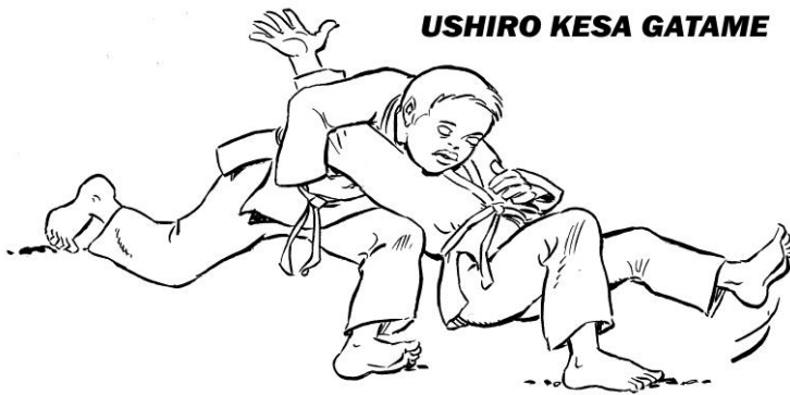
USHIRO KESA GATAME