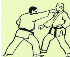
JODAN OIE TSUKI SÉRIE C