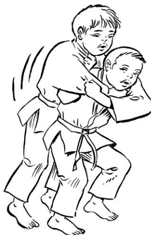
ERI SEI NAGE