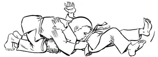
KAMI SHIHO GATAME