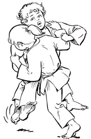
KO UCHI GARI