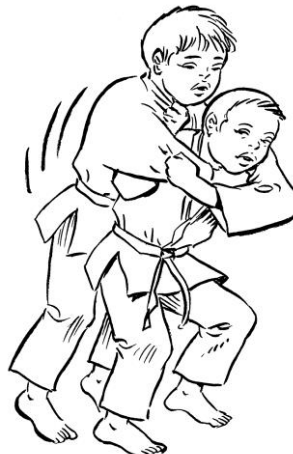
ERI SEOI NAGE