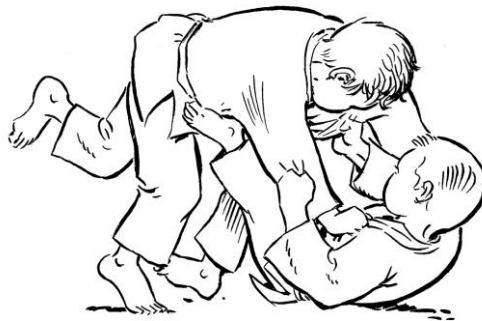
YOKO TOMOE NAGE