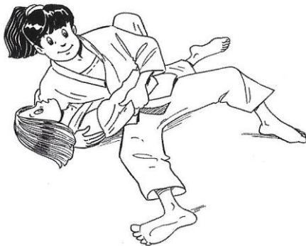
HON-GESA-GATAME CONTRÔLE LATÉRO-COSTAL