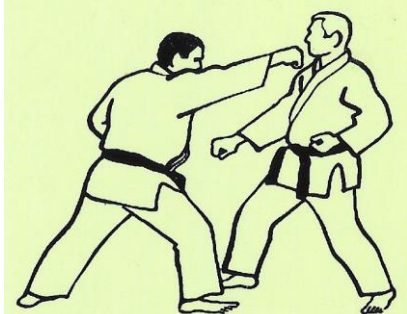
JODAN OIE TSUKI