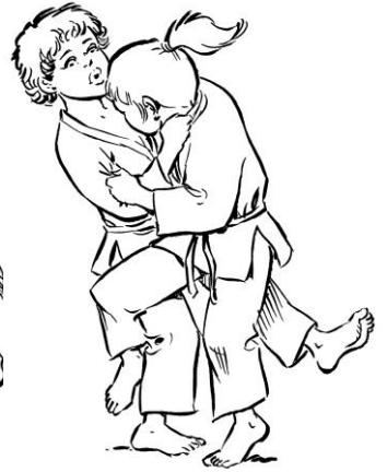
O SOTO GARI