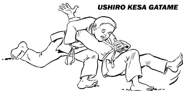
USHIRO KESA GATAME