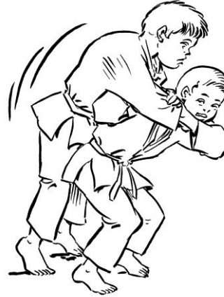
MOROTE SEOI NAGE