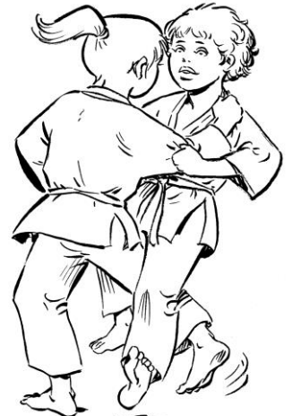
O UCHI GARI