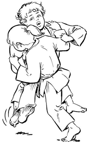
KO UCHI GARI