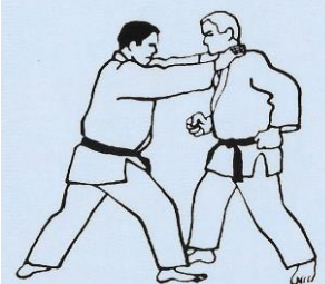
MAE DORI KUBI SÉRIE A