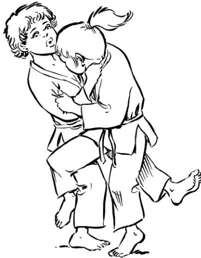
O SOTO GARI