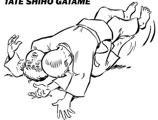
TATE SHIHO GATAME