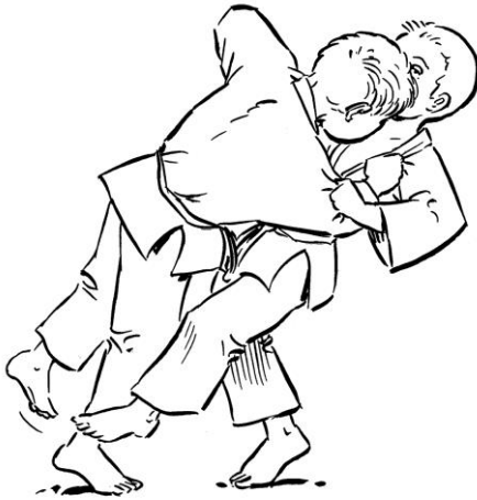
SASAE TSURIKOMI ASHI