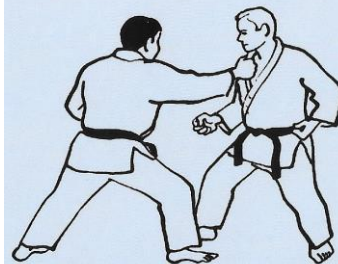
ERI DORI SÉRIE A