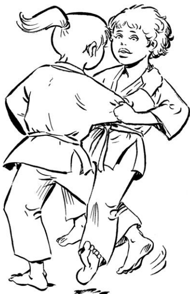
O UCHI GARI