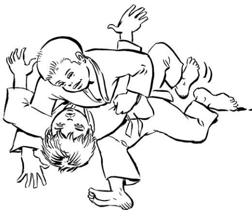
KUZURE GESA GATAME