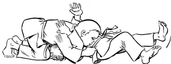
KAMI SHIHO GATAME