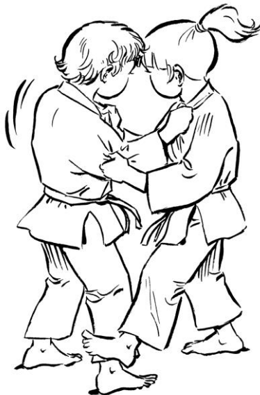
KO SOTO GARI