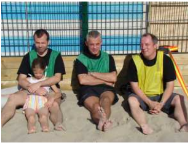
Terminé les vacances!