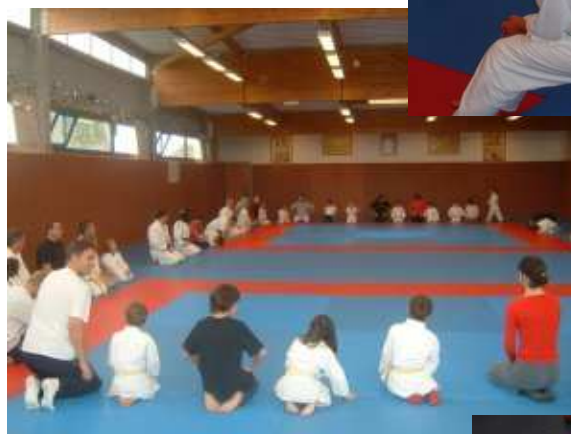
Quelques photos du week-end de 2007...du plaisir, de la bonne humeur et un peu de sueur